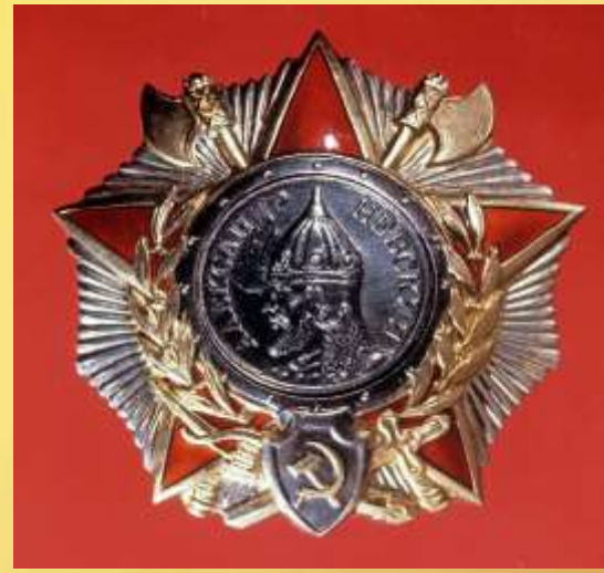
Орден Александра Невского