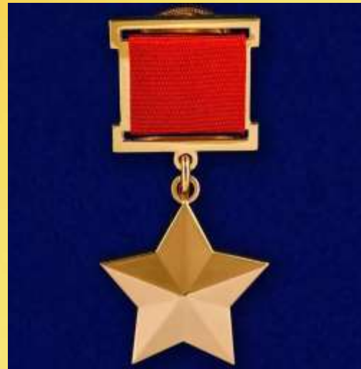
Медаль «Золотая звезда»