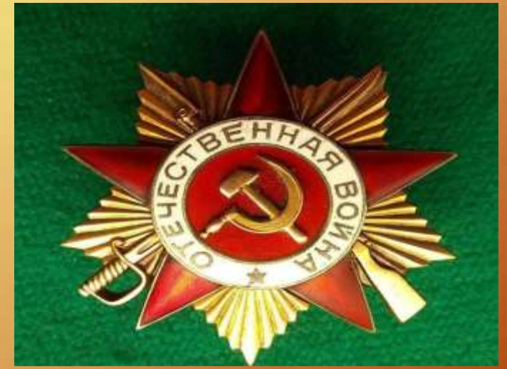
Орден Отечественной войны 1-й степени